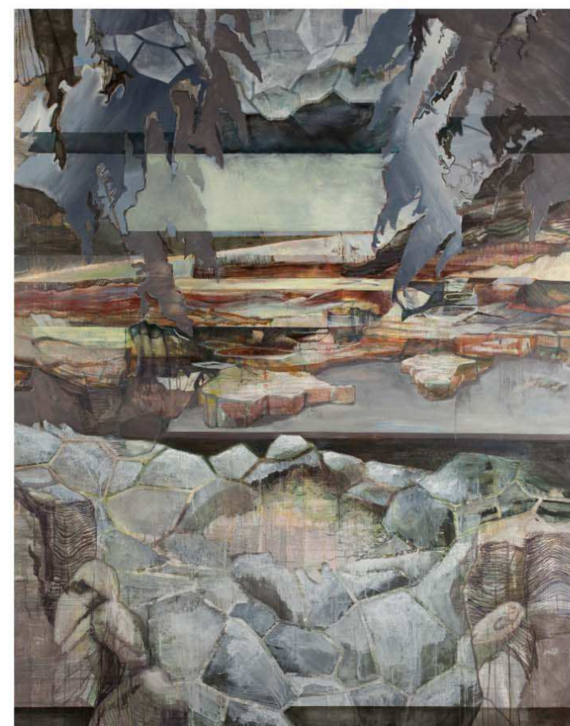
Ohne Titel, 2011, Acryl und Öl auf Leinwand, 300 x 240 cm

Wer mehr über die Arbeiten von Jenny Forster erfahren will: www.jenny-forster.de