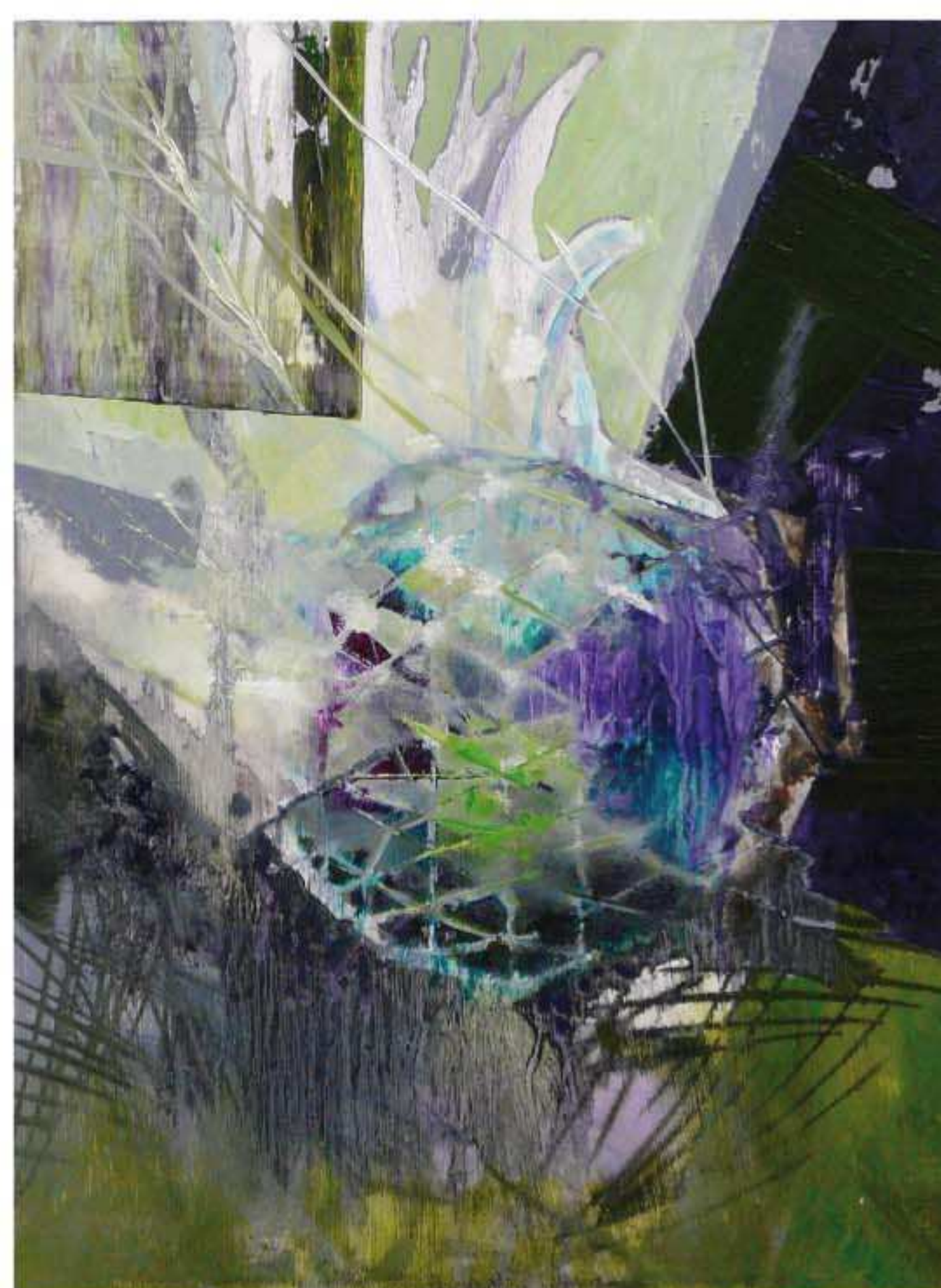
Ohne Titel, 2009, Öl auf Holz, 32 x 24 cm